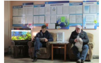
Zeitungslektüre: Was gibts Neues vom Melonenkönig...?

Veterinärinnen überzeugten uns in den Gesprächen am nächsten Tag ausnahmslos, so dass wir gar nicht lange hadern mussten und den Nachmittag im Geburtshaus von Marc Chagall, im Leinenladen unseres Vertrauens und im